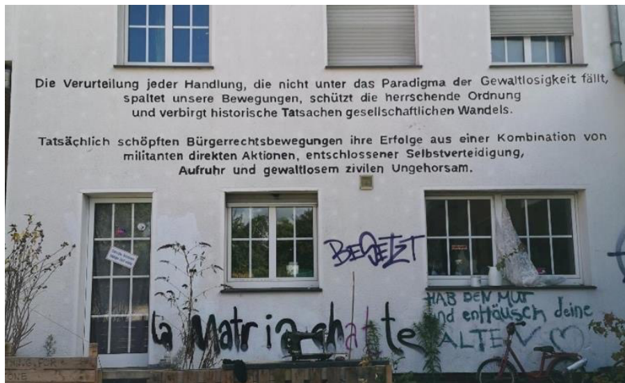
Imagen 5: «Condenar cualquier acción que no se ajuste al paradigma de la no violencia divide nuestros movimientos, protege el orden imperante y oculta los hechos históricos del cambio social. De hecho, los movimientos por los derechos civiles obtuvieron sus éxitos gracias a una combinación de acción directa militante, autodefensa decidida, disturbios y desobediencia civil no violenta».

Durante el desalojo, LL (17/01/2023) reportó incidentes que pusieron en peligro la vida y de la coacción ejercida por la operación policial. Sin embargo, en lugar de comparar el número de heridos 10 y culpar a los agentes individuales, los defensores de Lützerath reflexionan sobre la violencia sistémica de la policía como parte integrante del capitalismo (racial). Hacen referencia a la represión y la discriminación racial cerca de Lützerath (LL, 24/01/2023) y piden la abolición de este «órgano que apoya principalmente los intereses de un sistema capitalista» (LL, 20/01/2023).