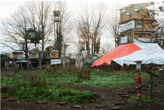
Imagen 1: Cabañas y casas en los árboles alrededor de la torre, donde los habitantes de Lützerath celebraban asambleas regulares del pueblo.

Es septiembre de 2022 en Lützerath, un pueblo ocupado al borde de una mina de carbón a cielo abierto, en Alemania (véanse las imágenes 1 y 2). Sentados dentro de un edificio donde una pared pintada con grafitis dice «El hermano verde te está lavando», escuchamos una conferencia titulada «Decrecimiento y justicia climática». Tras una elaborada crítica del capitalismo (verde), el ponente nos informa sobre soluciones de Decrecimiento: ciudades sin coches, comunalización de la tierra y viviendas sociales. Mientras debatimos estrategias, el ponente aplaude a Lützerath como una utopía actual por presagiar, en cierta medida, una sociedad de Decrecimiento. Unos días más tarde, mi amigo Gentian y yo reflexionamos sobre el taller mientras contemplamos la mina de 200 metros de profundidad. Sin impresionarse, Gentian se limita a encogerse de hombros. Llegamos a la conclusión de que todo lo que ofrecía la conferencia era una lista repetitiva de reformas y aludimos a la ironía de contemplar la relevancia de la lucha autónoma contra la expansión industrial para el Decrecimiento (Notas de campo, 24/09/2022; 05/10/2022). 1