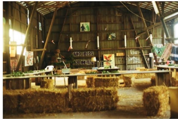
Imagen 2: «Sin dioses, sin amos»: Interior de una sala ocupada que se utilizaba como comedor común y taller.

En ocasiones, cuando la economía verde puede entenderse como un discurso que impide estratégicamente un cambio socioecológico radical mediante la mitigación de la ansiedad ecológica (Dunlap, 2023a), el Decrecimiento cobra cada vez más importancia a la hora de abordar la improbabilidad y las injusticias asociadas al crecimiento verde (Hickel y Kallis, 2020; Keyßer y Lenzen, 2021; Parrique et al., 2019; Tilsted et al., 2021). Además, este campo académico y movimiento social es rico en propuestas para formas menos destructivas y más igualitarias de organización socioecológica (D'Alisa et al., 2015; Hickel, 2019). Los debates públicos sobre las luchas contra la minería en Lützerath ilustran la relevancia del Decrecimiento, ya que se basan en gran medida en la dicotomía engañosa entre fuentes de energía renovables y no renovables (Dunlap y Marin, 2022).