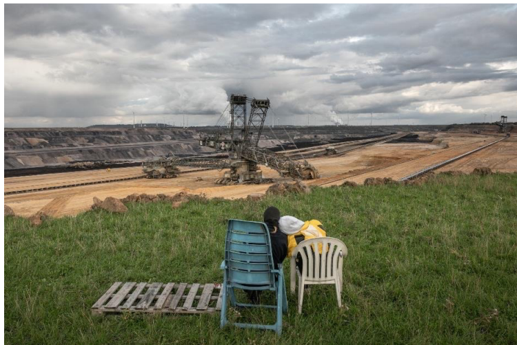
Imagen 3: Dos habitantes de Lützerath sentados al borde de Garzweiler II.

Lützerath estaba situada en el límite de Garzweiler II, al este de la ciudad de Erkelenz. Mencionada por primera vez en los mapas en 1168, Lützerath estaba compuesta por tres granjas, varias casas, bosques y un estanque, con un máximo de 105 habitantes en 1970 (Virtuelles Museum Erkelenz, s. f.). Mientras que la extracción de esta fuente de energía altamente destructiva y contaminante es continua en el este de Alemania, Lützerath fue uno de los últimos de más de 100 pueblos demolidos por el lignito en Renania.