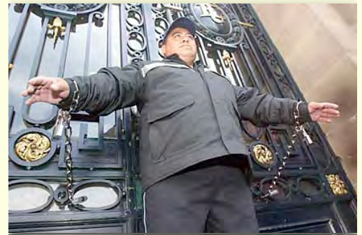
Un policía de la Ciudad de México se encadena a las puertas principales de la Asamblea de la Ciudad en protesta porque su salario no es un salario digno (19 de diciembre de 2006).

Un salario digno es, universalmente, el elemento más importante en el logro del derecho de todos a una vida digna y a la erradicación de la pobreza. En relación a la responsabilidad social de las empresas, una corporación o entidad organizacional que emplee a personas, independientemente del tamaño o el giro, pública o privada, no puede ser considerada con un comportamiento socialmente responsable si no paga un salario digno, no importa qué tan responsablemente se comporte en todas las demás áreas de su actividad.